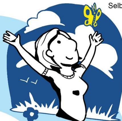
Illustration: Tim Knoche